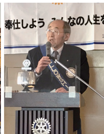
結婚記念日卓話 遠田会員