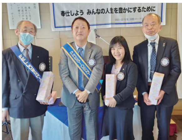
12月の三つのお祝い